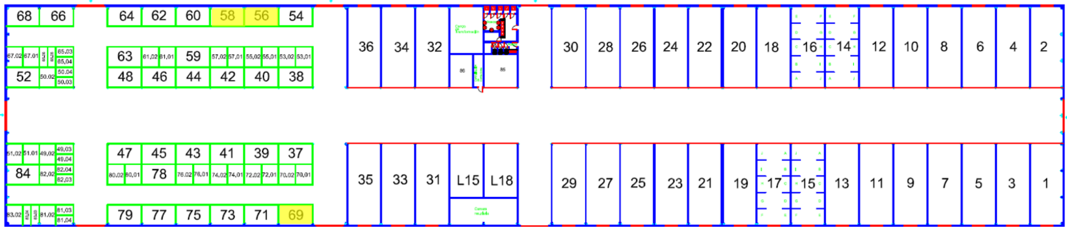
NAVE "B" FRUTAS Y HORTALIZAS